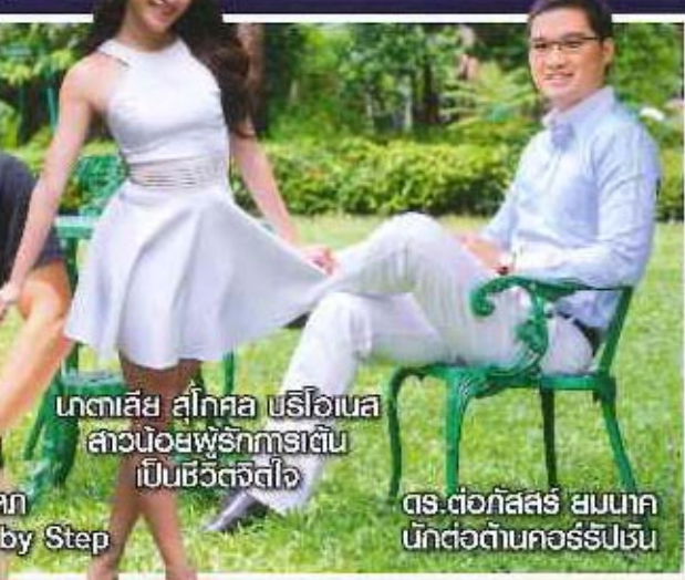
เกศาสัย สุกศล บริโอบาส สาวน้อยพรีการเริ่มต้น เป็นชีวิตจริงใจ